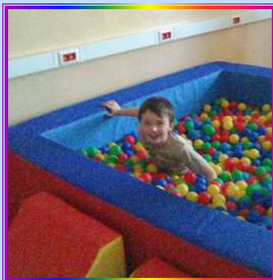
Zabawy w salce zabaw