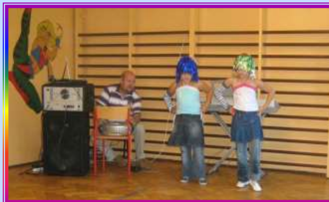
„Pokaż co potrafisz”