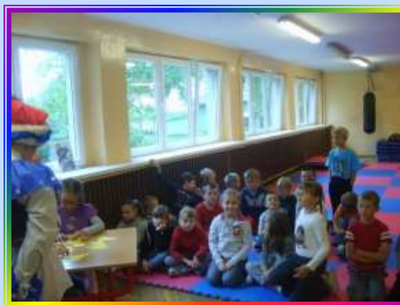
Pasowanie na czytelnika pierwszoklasistów