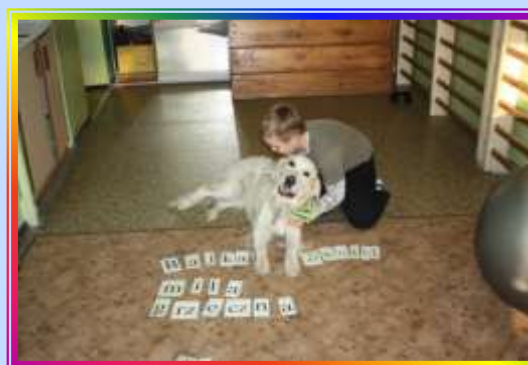
Zajęcia z dogoterapii